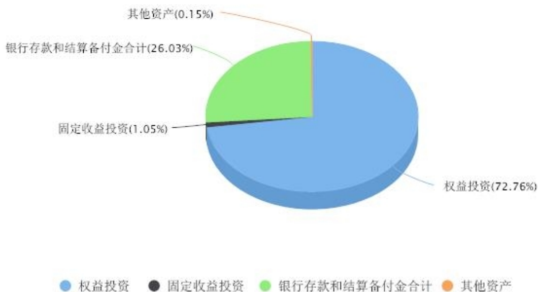
投资组合资产配置图表 数据截止日期:2024年06月30日